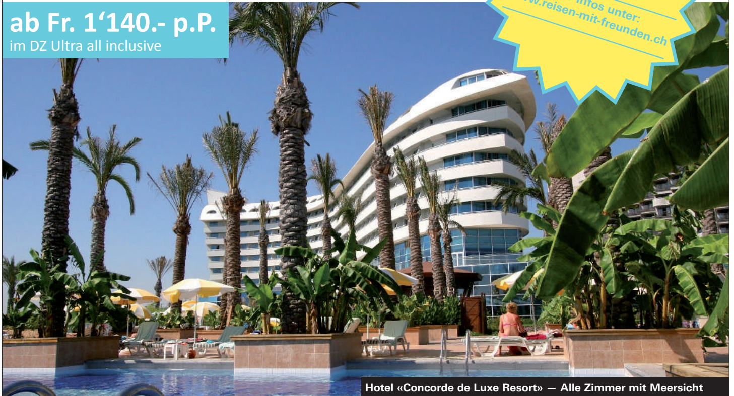
Hotel «Concorde de Luxe Resort» – Alle Zimmer mit Meersicht