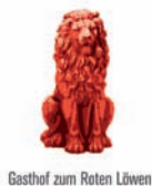
Gasthof zum Roten Löwen

Gasthof zum Roten Löwen Gasthof | Hotel | Bar | Lounge Ringstrasse 21 5452 Oberrohrdorf Telefon 056 496 95 05 www.zum-roten-loewen.ch